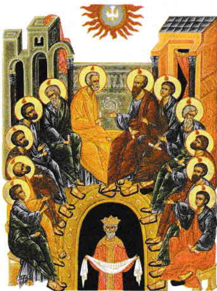
Pogorârea Duhului Sfânt