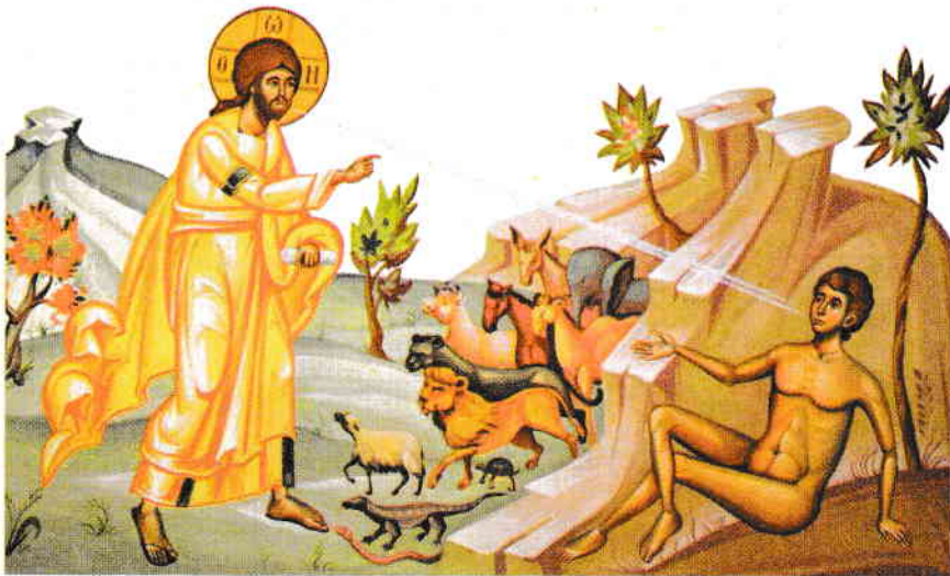
Ziua a șasea a Creației